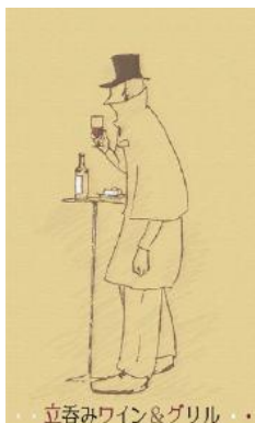
立呑みワイン&グリル